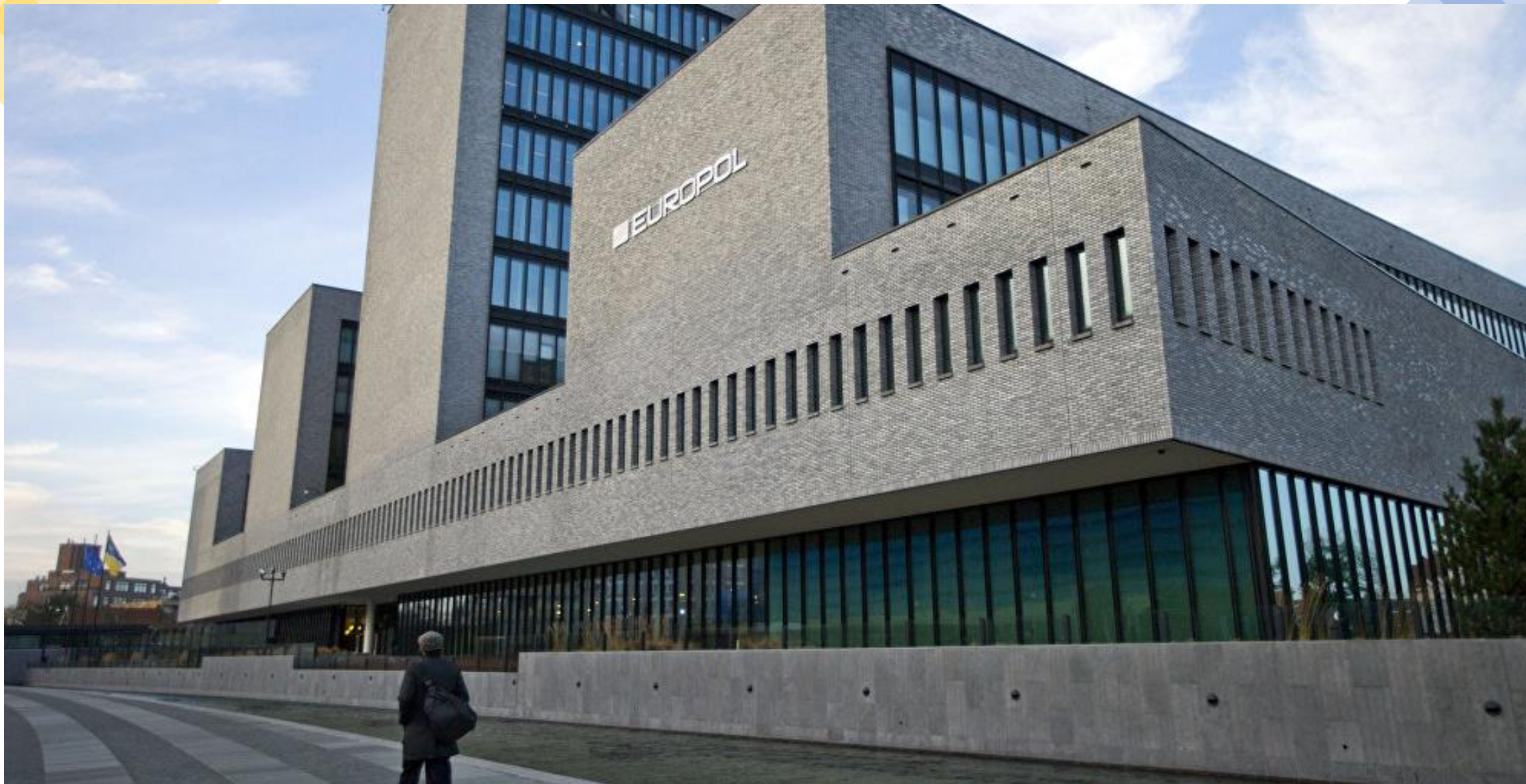
Siedziba: Haga, Holandia