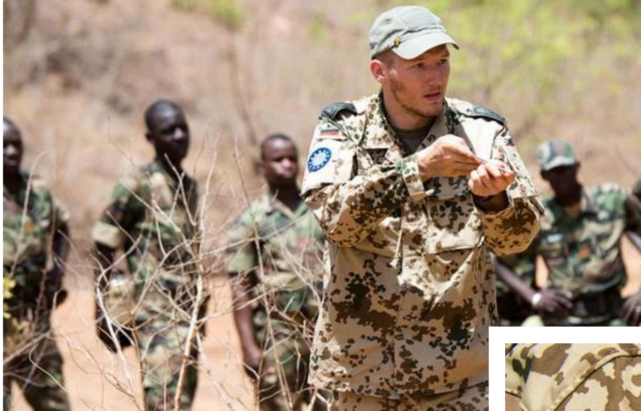
Zdjęcie ze szkolenia żołnierzy G5 Sahel przez żołnierza Republiki Niemieckiej.