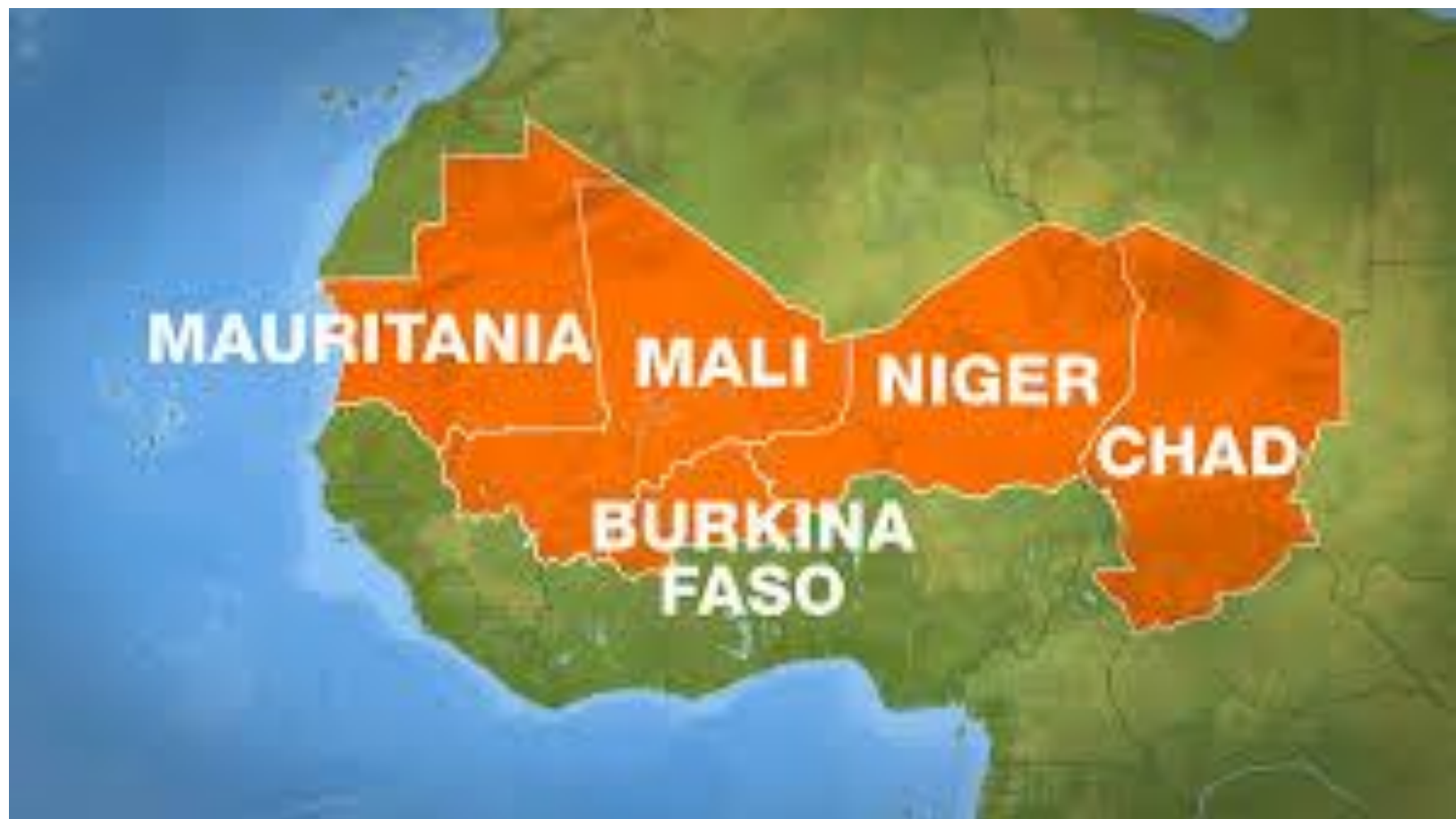
Państwa tworzące G5 Sahel