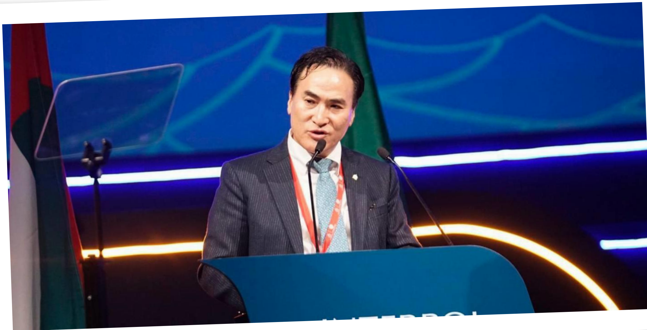
Prezydent Interpolu: Kim Jong Yang