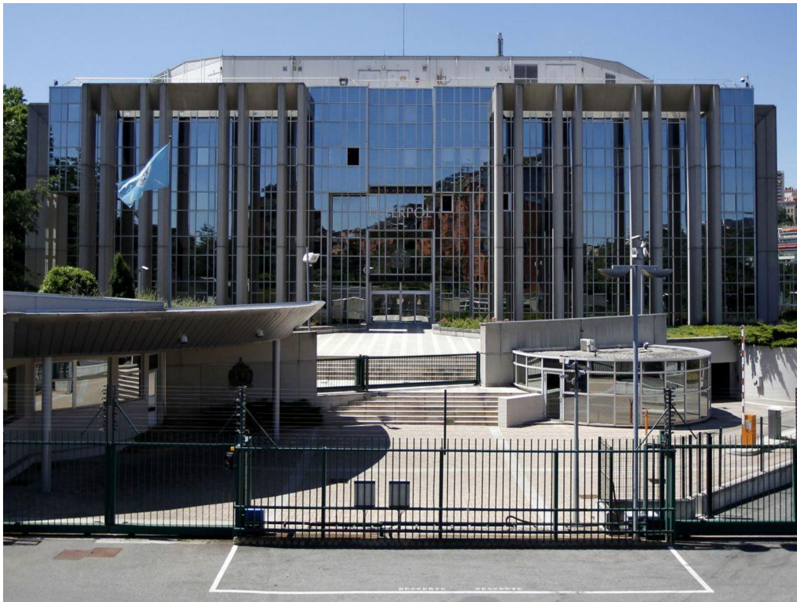
Siedziba Interpolu: Lyon, Francja