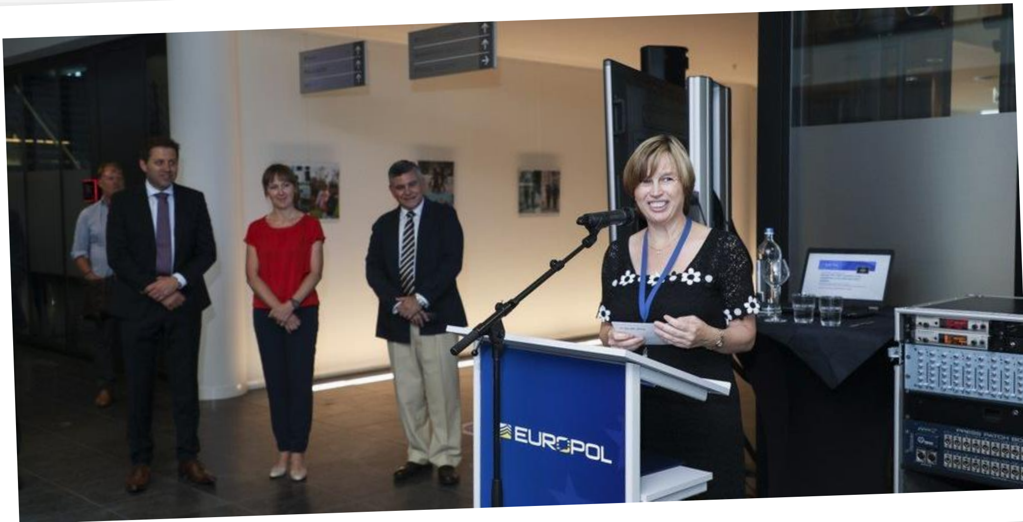
Dyrektorka Europolu: Catherine De Bolle