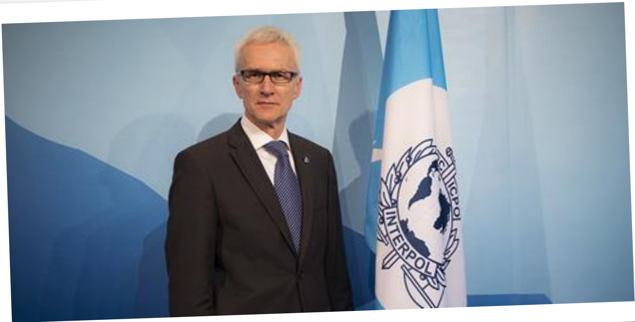
Sekretarz Generalny: Jürgen Stock