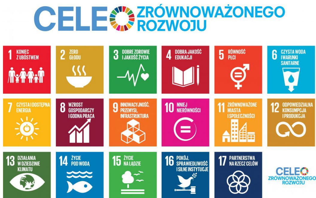
Ilustracja 1. Cele Zrównoważonego Rozwoju